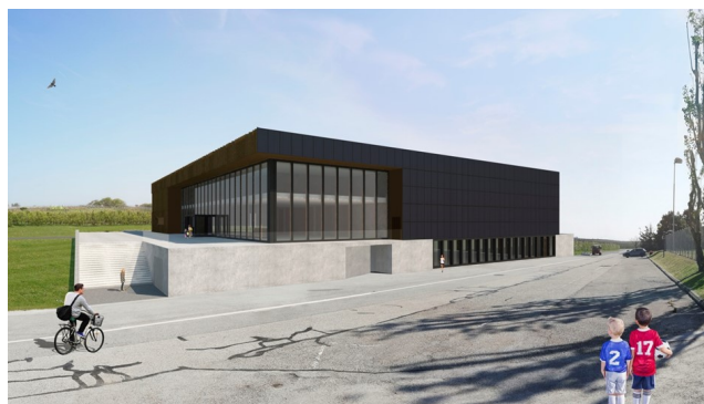
Image de synthèse du futur bâtiment multifonctions

Nous ne manquerons pas de vous tenir au courant du suivi de cet important dossier.