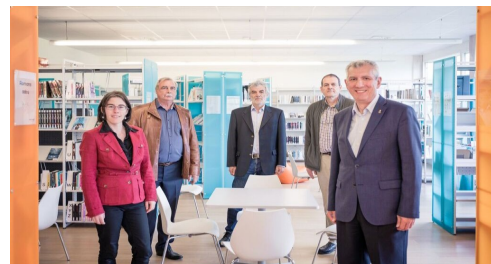
La Municipalité d'Etoy, législature 2016-2021