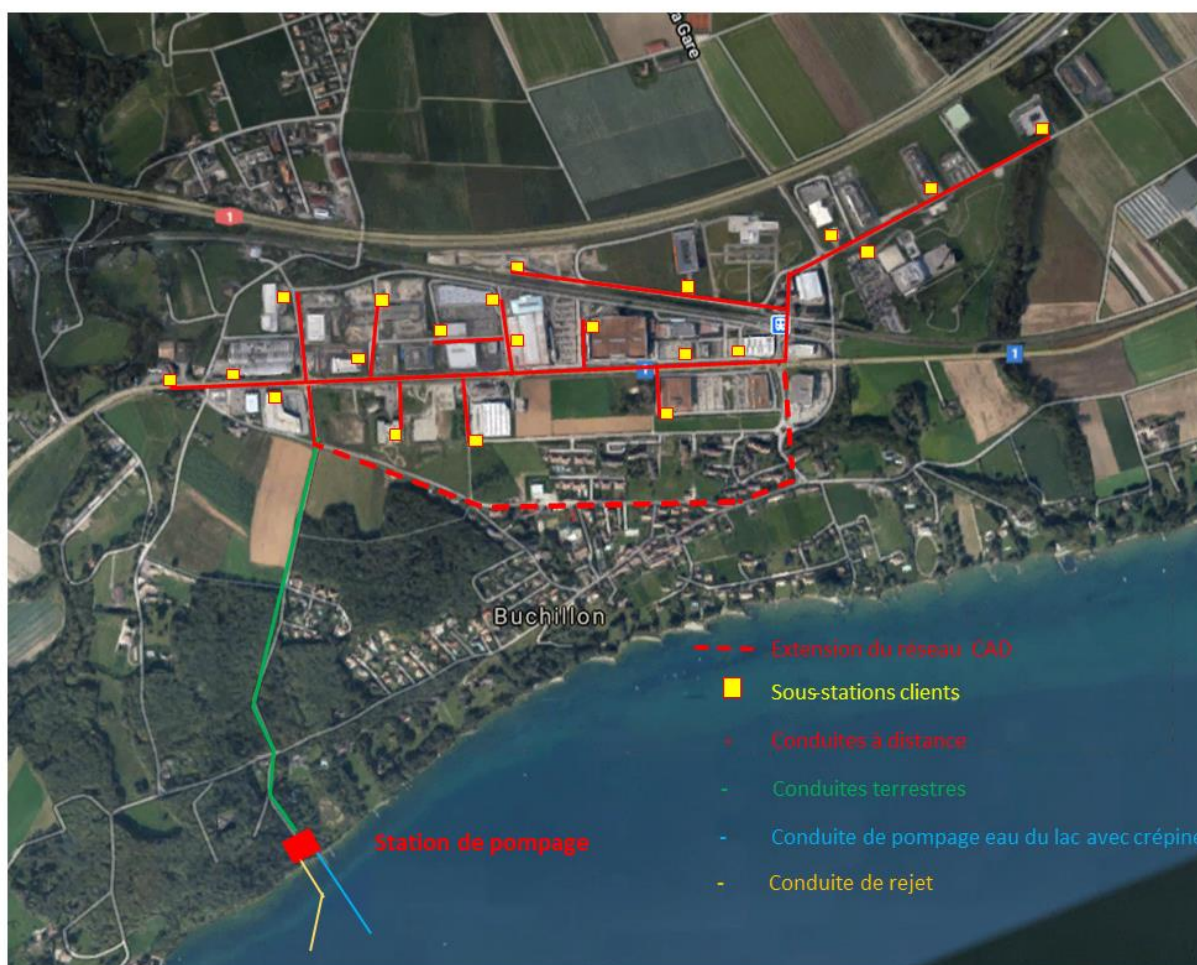
Image aérienne avec une hypothèse de situation de la STAP et les distances à prévoir

L'étude de faisabilité devrait valider la possibilité d'installer une station de pompage et de rejet sur la parcelle 232 de la commune de Buchillon située en bordure du lac, d'une surface de 534 m 2 .